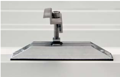
C-Schiene mit Endklemme