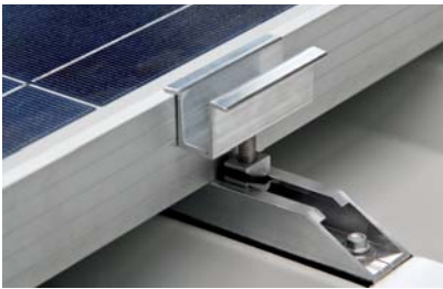
C-Schiene mit Mittelklemme