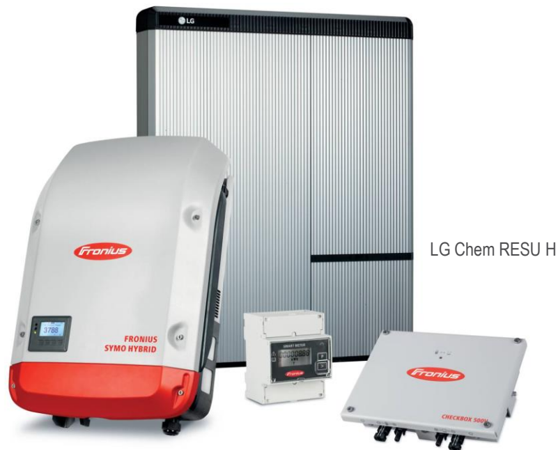
Fronius Symo Hybrid