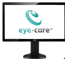
BenQ GL2450HT Monitor