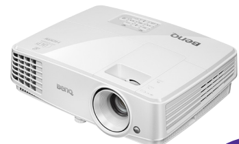
BenQ MS514H Videoprojektor