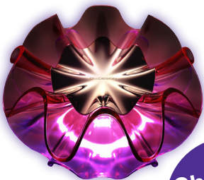
BenQ Flamenca LED-bordlampe