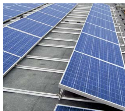
Ballastoptimeret montage på fladt tag