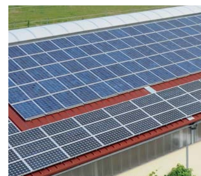
Montage på Trapeztag