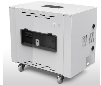
RESU 5.0 (5kWh)